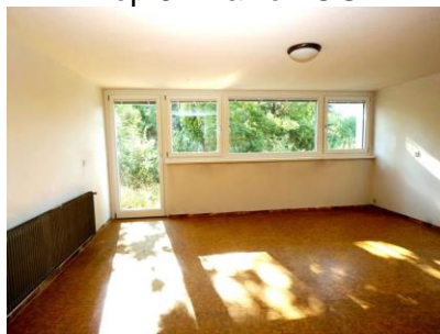
Einliegerwohnung - Zimmer UG