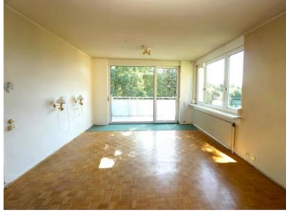
Top 6 - Zimmer 1 OG