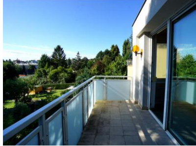
Top 6 - Balkon OG