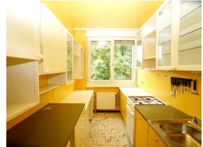
Top 6 - Küche OG