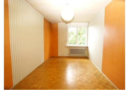
Top 6 - Zimmer 4 OG