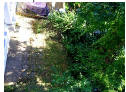
Einliegerwohnung - Garten UG