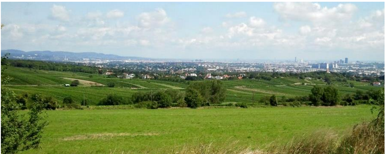
UNVERBAUBARER SENSATIONELLER WIENBLICK ÜBER WIESEN UND WEINGÄRTEN!